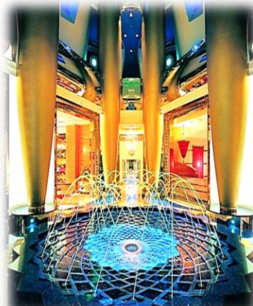
شكل (4) يوضح التنوع التصميمي المتميز في العمل التقني [25]