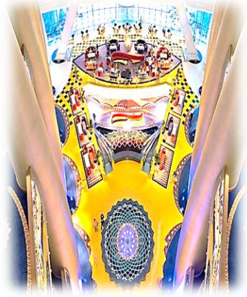
شكل (5) يوضح التنوع التقني من خلال الصورة التصميمية المعتمدة على اساس (اللون، الشكل، الملمس، الاتجاه) [26]

الخط، المضمون، التصميم، الصورة الحسية، المشروع الجديد) ينظر للشكل (3)،(6)،(8)، كذلك برزت سمات الصياغة الفكرية المحفزة للصورة التصميمية في الفضاء الداخلي المعاصر لفندق برج العرب بإنها لها دور كبير وفعال في توضيح وفهم الفكرة التصميمية من أجل تحفيز عملية جذب المتلقي للتصميم التقني المعاصر بسبب الرؤية الجيد للصورة التصميمية ذات البعد التقني ينظر للشكل (4)،(5)،(7)، كما سعى المصمم الداخلي في عمله التقني الى توظيف الخصائص البصرية بحسب الصورة التصميمية للفضاء الداخلي المعاصر لفندق برج العرب، من أجل التعبير التصميمي عن الاداء التقني لتلك الفضاءات وكذلك للتعبير عن فكرته التصميمية، لما تحمله تلك الصورة بتصميمها من دلالات تعبيرية محفزة في توجيه النشاط الانساني داخل الفضاءات الداخلية ينظر للشكل (6)،(7)،(8).