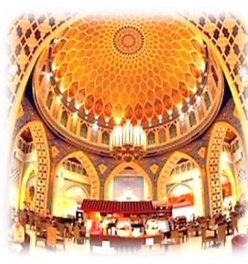
شكل (6) يوضح بناء الفكرة التصميمية المستندة الى التنوع التقني والمرتكزة على اساس المبادئ والعلاقات التصميمية [27]