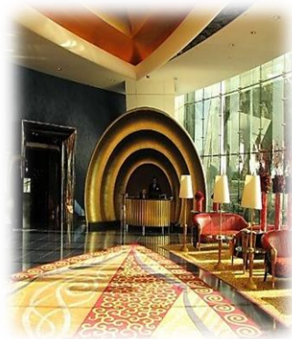
شكل رقم (8) يوضح سعى المصمم الداخلي في عمله التقني الى توظيف الخصائص البصرية بحسب تكوين الصورة التصميمية للفضاء الداخلي [29]