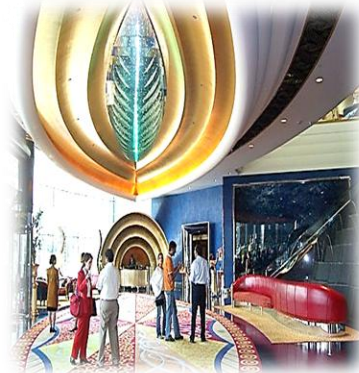
شكل (7) يوضح دراسة اطار كفاءة العمل التقني المعبر والمتفرد من خلال اظهاره لصوره تصميمية جديدة للفضاء الداخلي [28]