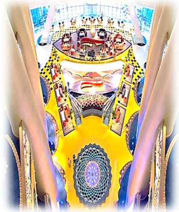
شكل (5) يوضح التنوع التقني من خلال الصورة التصميمية المعتمدة على اساس (اللون، الشكل، الملمس، الاتجاه) [26]

الخط، المضمون، التصميم، الصورة الحسية، المشروع الجديد) ينظر للشكل (3)،(6)،(8)، كذلك برزت سمات الصياغة الفكرية المحفزة للصورة التصميمية في الفضاء الداخلي المعاصر لفندق برج العرب بإنها لها دور كبير وفعال في توضيح وفهم الفكرة التصميمية من أجل تحفيز عملية جذب المتلقي للتصميم التقني المعاصر بسبب الرؤية الجيد للصورة التصميمية ذات البعد التقني ينظر للشكل (4)،(5)،(7)، كما سعى المصمم الداخلي في عمله التقني الى توظيف الخصائص البصرية بحسب الصورة التصميمية للفضاء الداخلي المعاصر لفندق برج العرب، من أجل التعبير التصميمي عن الاداء التقني لتلك الفضاءات وكذلك للتعبير عن فكرته التصميمية، لما تحمله تلك الصورة بتصميمها من دلالات تعبيرية محفزة في توجيه النشاط الانساني داخل الفضاءات الداخلية ينظر للشكل (6)،(7)،(8).