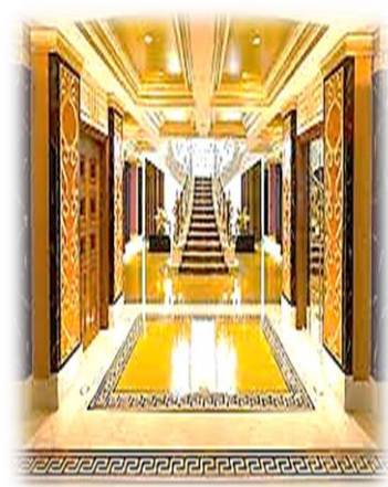
شكل (3) يوضح دراسة المصمم الداخلي الى تقنية العمل التصميمي من خلال صورته التصميمية المتنوعة [24]