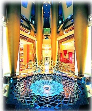
شكل (4) يوضح التنوع التصميمي المتميز في العمل التقني [25]