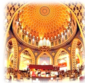
شكل (6) يوضح بناء الفكرة التصميمية المستندة الى التنوع التقني والمرتكزة على اساس المبادئ والعلاقات التصميمية [27]